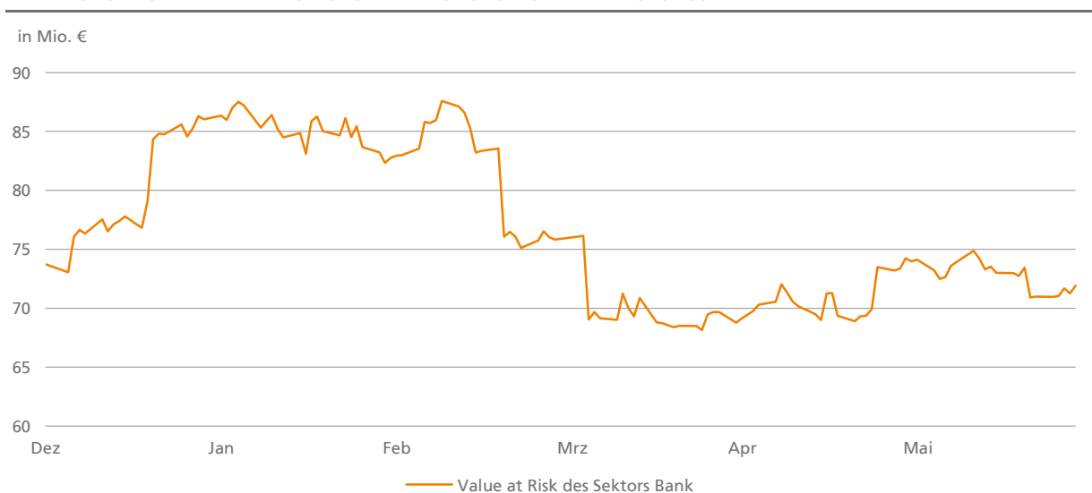
ABB. VI.23 – SEKTOR BANK: HANDELSTÄGLICHE ENTWICKLUNG DES MARKTPREISRISIKOS 1

1 Value at Risk bei 99,0 Prozent Konfidenzniveau, 1 Tag Haltedauer, 1 Jahr Beobachtungszeitraum auf Basis eines zentralen Marktpreisrisikomodells für den Sektor Bank. Die Risiken wurden unter vollumfänglicher Beachtung von Konzentrations- und Diversifikationseffekten ermittelt.